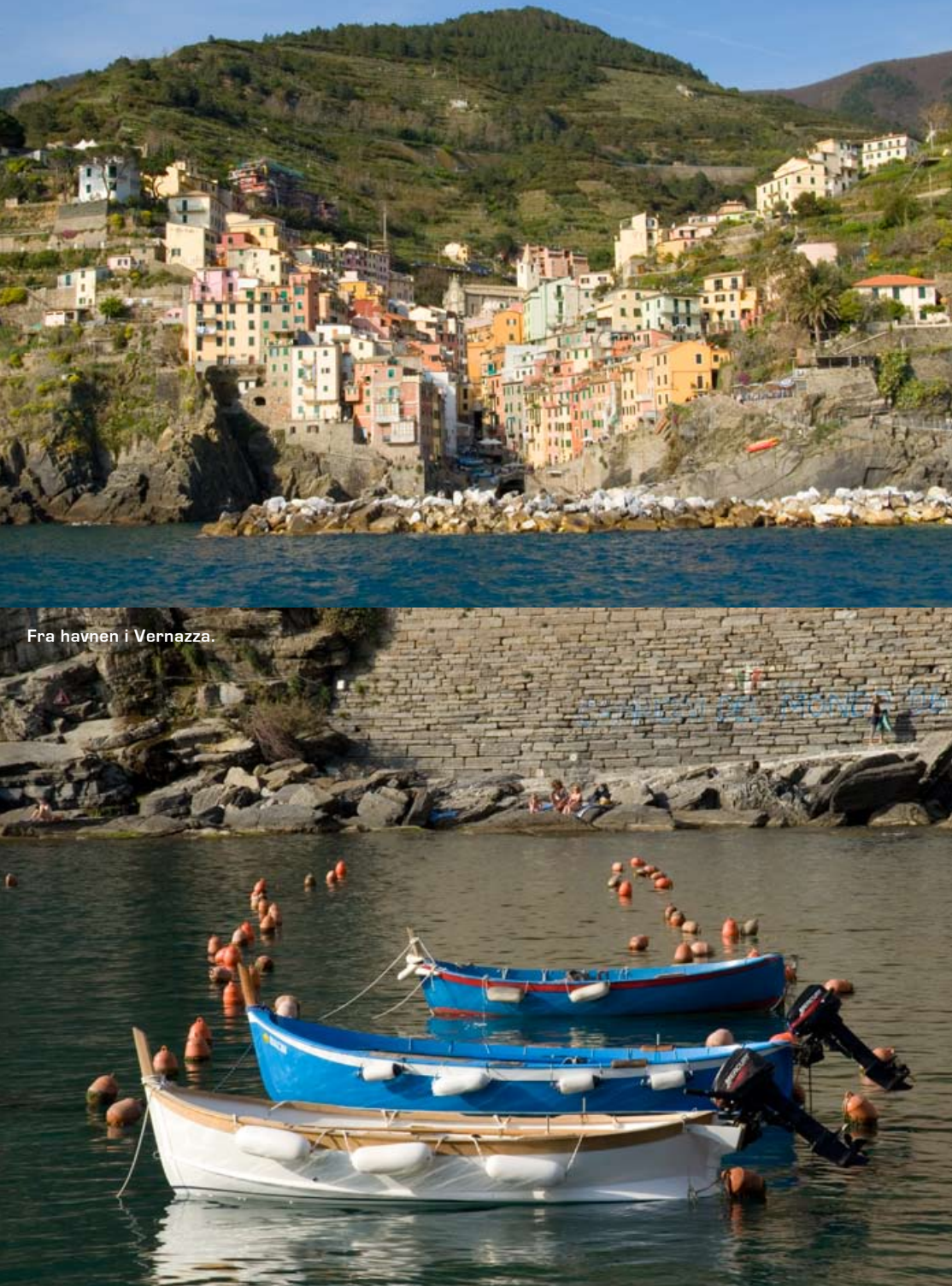
Fra havnen i Vernazza.