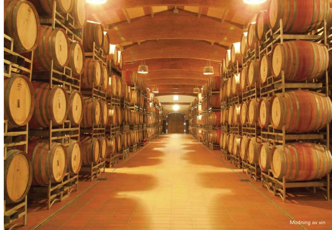
Modning av vin

Piemonte-regionen er et av Italias skattkammer når det gjelder mat og vin. Dette er regionen alle virkelige seriøse vinkjennere drømmer om å besøke. Herfra kommer de kjente vinene Barolo og Barbaresco, for ikke å glemme Asti – den søte dessert-vinen. Piemonte kan minne litt om Toscana, med sitt kuperte landskap og vinranker så langt øyet kan se. Men samtidig så totalt anderledes! Dette kan man også kjenne på maten de tilbereder. Piemonte byr på en mer kraftig mat, med mye bruk av sopp og trøffel. Regionen, med unntak av Torino, er landsbygd. Mot sør ligger de vinmarkkledde åsene rundt Barolo og de tilsynelatende endeløse jordene med korn og ris, ofte brukt i retten risotto. Det er mange koselige småbyer å besøke; Alba, Asti og Acqui Terme for å nevne noen.